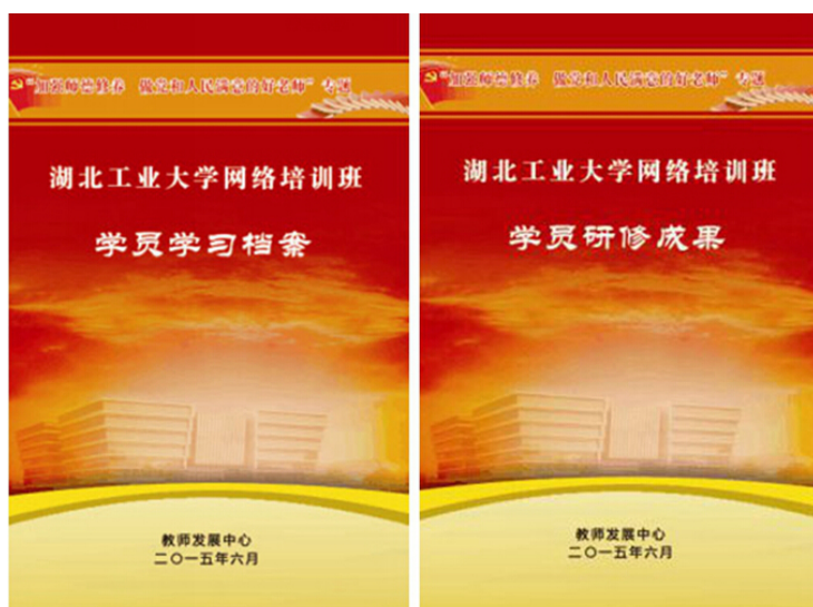
网络培训班学员学习档案 和研修成果集

3月初，教师发展中心本学期初接手“加强师德修养 做党和人民满意的好老师”专题网络培训工作。对前期学员的学习的进行全面摸底，并积极主动联系中国教育干部网络学院衔接培训工作。针对学院（部）和学员下发了《关于推进“加强师德修养做党和人民满意的好老师”专题网络培训的通知》。截至目前，已注册学员已全部完成在线学习30学时和撰写总结。教师发展中心已将汇编成册。