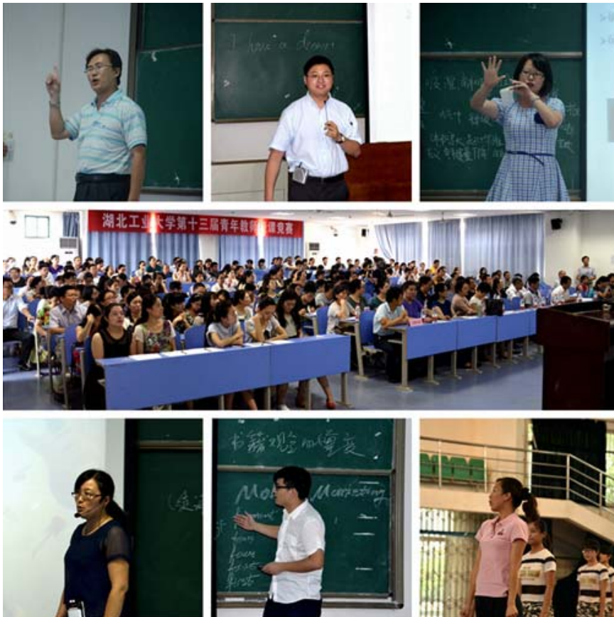
青年教师授课竞赛 决赛现场