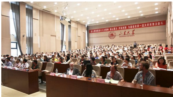
第三届教学促进与教师发展年会会场

此外，教师发展中心还积极组织教师参加山东大学举办的第三届教学促进与教师发展年会。作为国内有影响力的教师发展年会之一，本次年会有国内85所高校的两百多位代表参会。