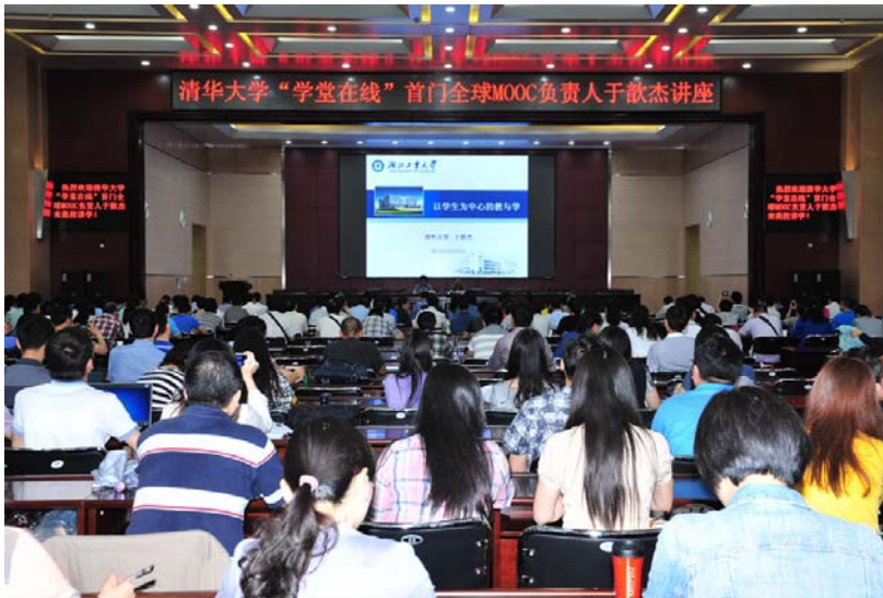
“以学生为中心的教与学” 报告会现场