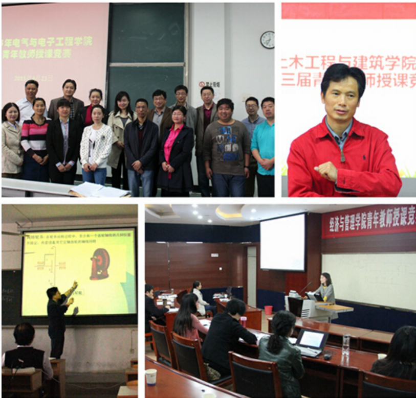
青年教师授课竞赛院（部） 预赛现场