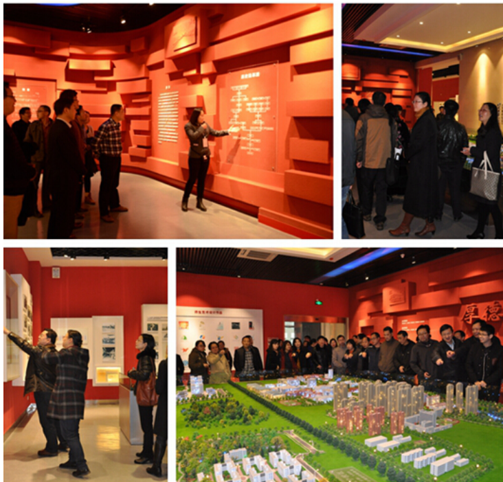
左上：理学院参观校史馆

3月中旬开始，教师发展中心联合档案馆广泛开展“学校史、知校情”爱校教育，先后组织13个学院（部）的1000余名教师分批参观校史馆，学习学校发展历史。通过参观，大家从学校厚重文化积淀中感受“厚德博学、求实创新”精神，学习湖工大历代建设者们实干、奋进的作风，增强了对学校的归属感、认同感与自豪感，也深感肩上责任和使命之重，纷纷表示要立师德树新风，倾心教书育人，奉献学校发展。