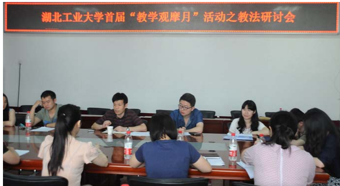
首届教学观摩月之 教法研讨会会场

学校首届教学观摩月活动分为“教学观摩—教法研讨—教艺展示”三部曲。45名新进教师在完成一个月的观摩任务后，参与教法研讨活动。后期，教师发展中心将组织新教师以“说课”或者“讲授”的形式进行“教艺展示”。